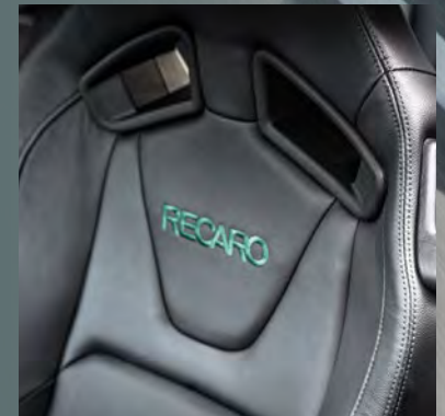
Recaro-Sportsitze vorn in Leder-Optik mit grünen Ziernähten (optional)