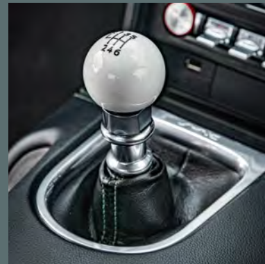
Schaltknauf im Bullitt TM -Design