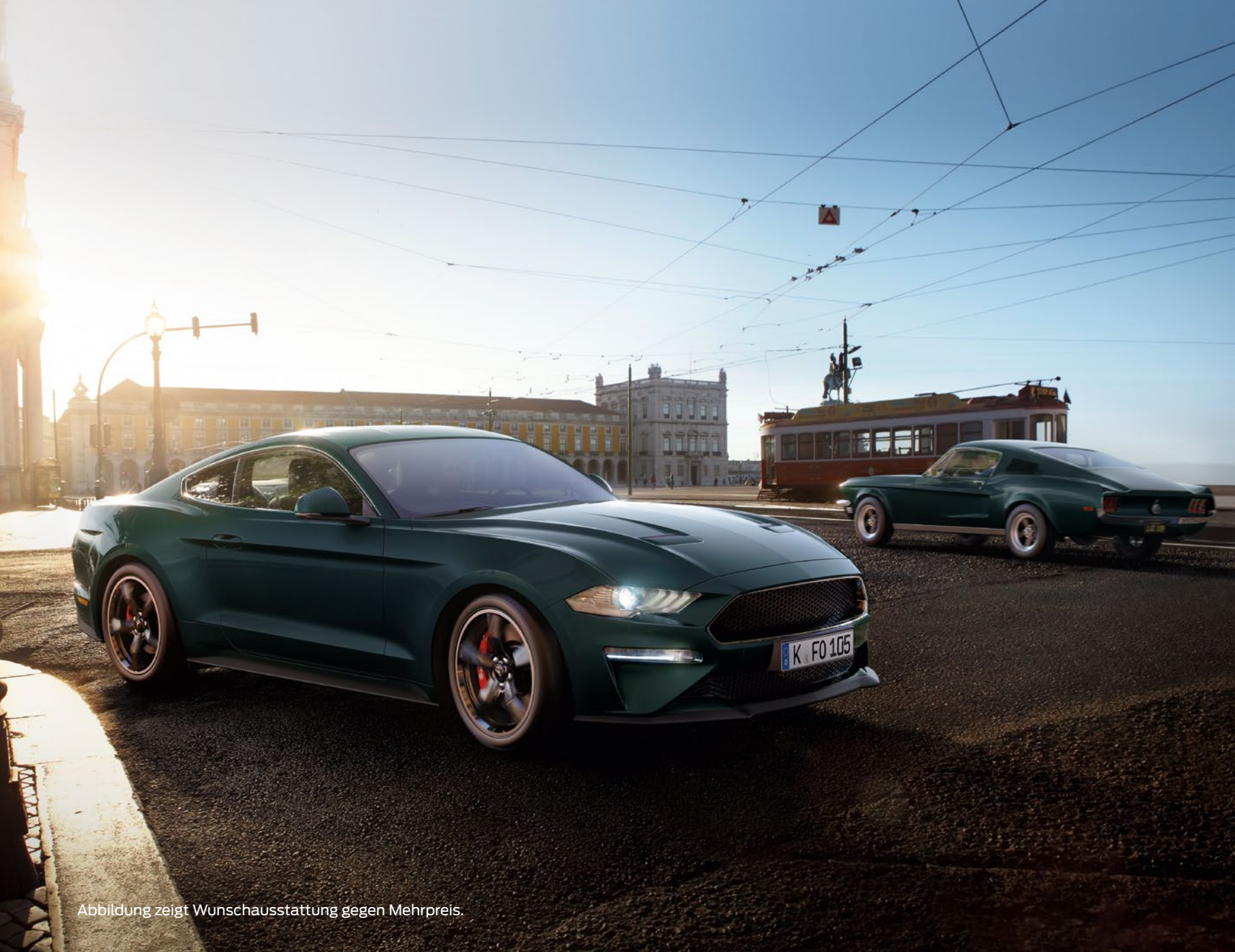
Abbildung zeigt Wunschausstattung gegen Mehrpreis.