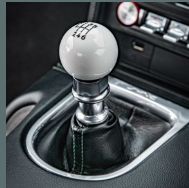
Schaltknauf im Bullitt TM -Design