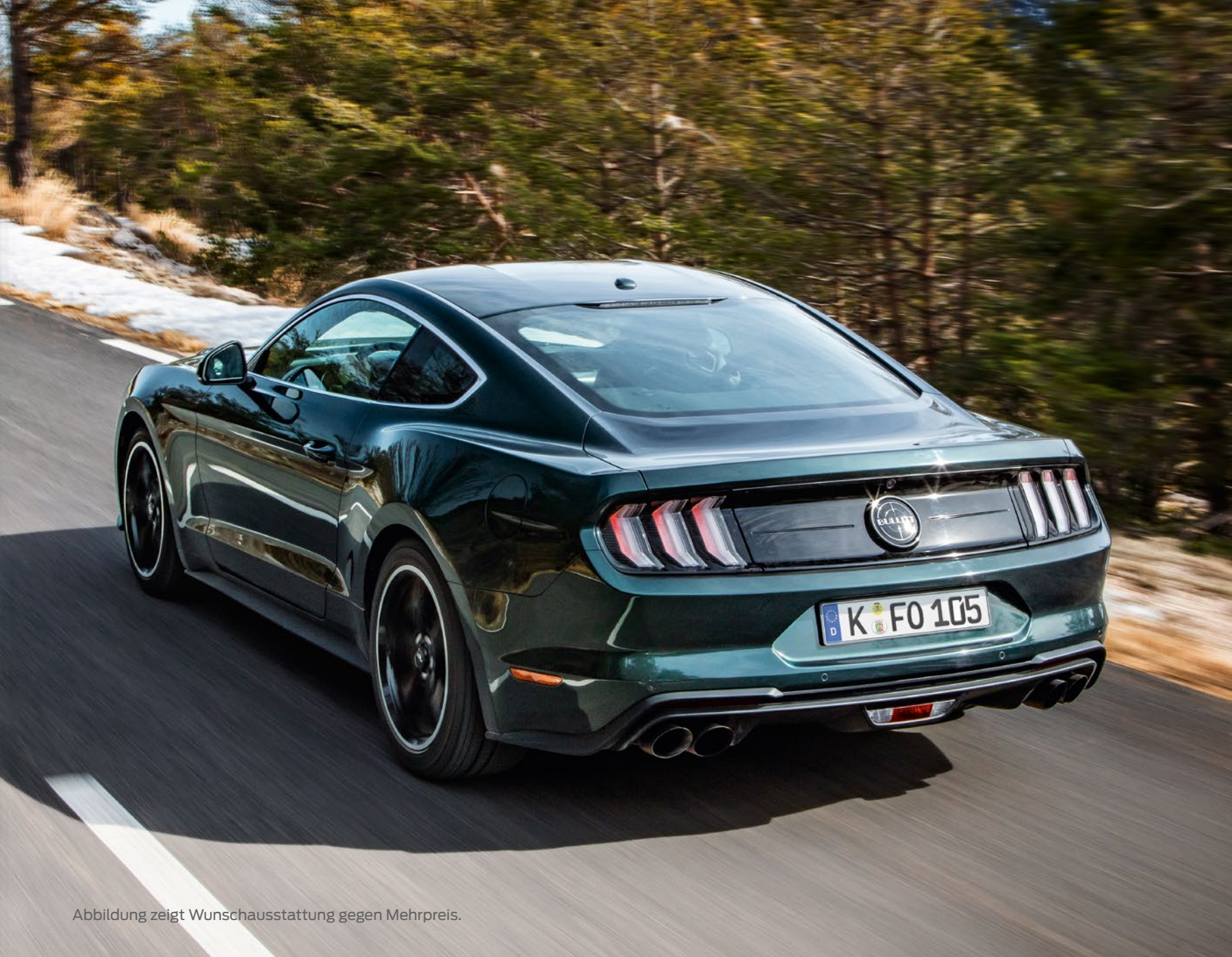
Abbildung zeigt Wunschausstattung gegen Mehrpreis.